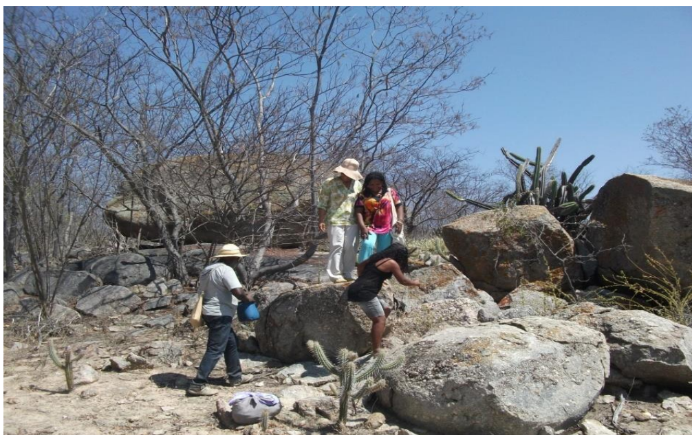
Foto 01 - Subida na Pedra do Matame (A pesquisadora, Liderança e Professoras)

Na primeira viagem, no dia 10 de setembro de 2015, passamos dois dias na comunidade. Viajamos na sexta-feira à noite, às 23:00h, e chegamos em Salgueiro no dia 11, às 07:00h da manhã. Na rodoviária, uma pessoa da comunidade nos esperava para viajarmos os 42 Km de Salgueiro até Conceição das Crioulas. No sábado, depois do café da manhã na casa de uma professora, onde a mesma nos ofereceu café, leite, pão, mortadela, bolacha, nos dirigimos para a AQCC. De lá, sairíamos para um reconhecimento de área: fomos à Pedra do Matame, uma pequena serra, de onde se pode enxergar do alto uma área do território, onde, naquele período, a escola junto com a comunidade estava realizando um conhecimento da extensão da área com vistas a desenvolver o processo de gestão do território.