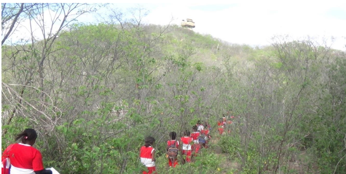
Foto 09 - Aula passeio: atividade de reconhecimento do território com as crianças

medicinais, os lajeiros, as capoeiras. Os pequeninhos da Educação Infantil, ficaram na parte baixa da Serra e fizeram o mesmo trabalho também. E isso estamos trabalhando pedagogicamente. Os meninos trabalharam arte e matemática quando fizeram a maquete. A gente tirou a palavra geradora como Paulo Freire dizia, de dentro do T E R R I T Ó R I O, trabalhamos o que é território, quantas letras tem a palavra território, quantas sílabas tem. Isso com os pequeninhos (C).