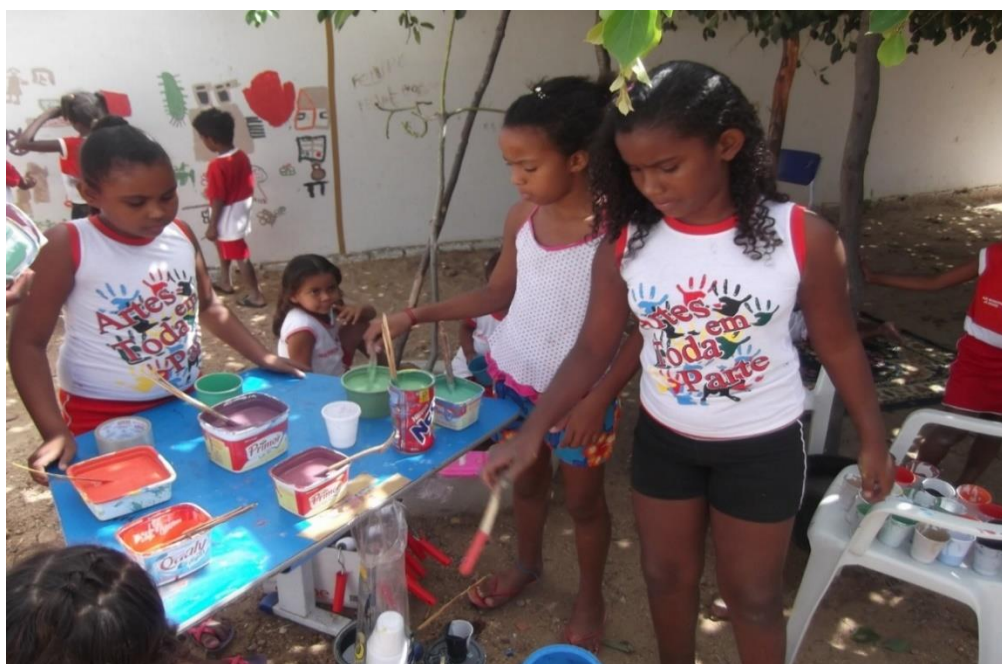
Foto 14 - Projeto Arte em toda Parte: crianças sob a copa da Noz de Cola

A copa da árvore protege para a realização de atividades, conforme se vê discretamente à direita na parte superior da foto abaixo.