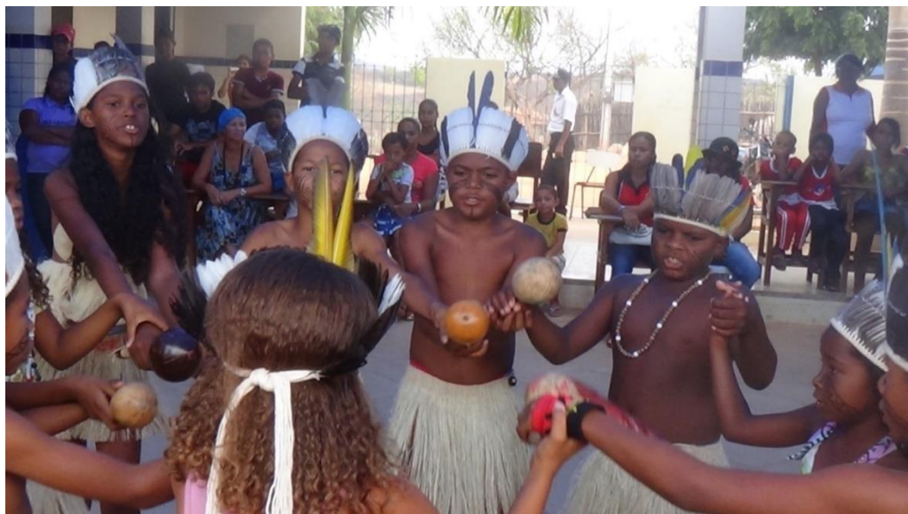
Foto 12 - Intercâmbio intercultural com Povo Indígena Atikum