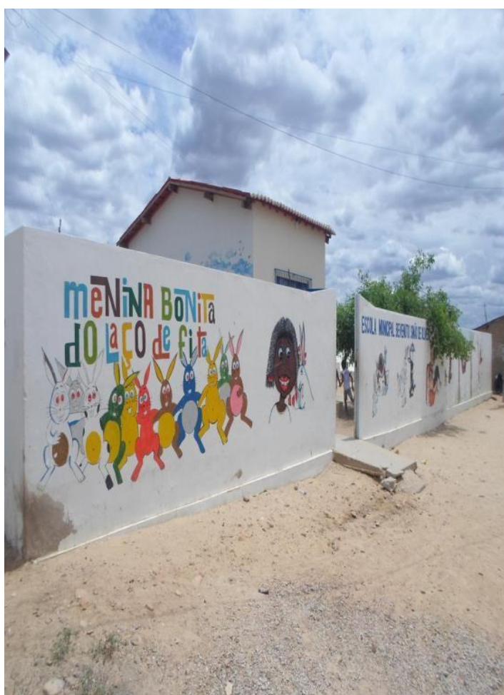
Foto 06 - Escola Bevenuto Simão em 2015

O resultado nós vemos na foto a seguir, com imagens alusivas ao livro de Ana Maria Machado, intitulado Menina Bonita do Laço de Fita , escolhido pela comunidade para ilustrar o muro externo da escola.