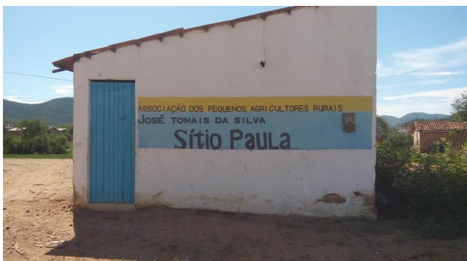
Foto 02 - Associação de Moradores do Sítio Paula, Conceição das Crioulas-PE

A gestão do território envolve as escolas, a Associação do Sítio Paula e a AQCC como guardião do território e organização política que exerce a representação dele. No domingo, participamos da Assembleia da Comunidade no Sítio Paula, onde apresentamos o nosso interesse de pesquisa e solicitamos autorização para desenvolvermos nosso trabalho na comunidade e na escola. A assembleia nos aceitou por aclamação, permitindo que desenvolvêssemos nosso trabalho no tempo que fosse necessário.