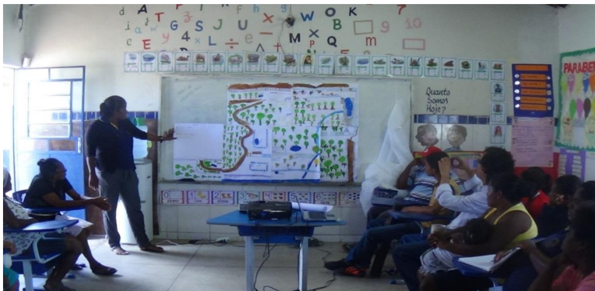
Foto 10 - Assembleia da comunidade: professora apresentando a atividade de reconhecimento do território