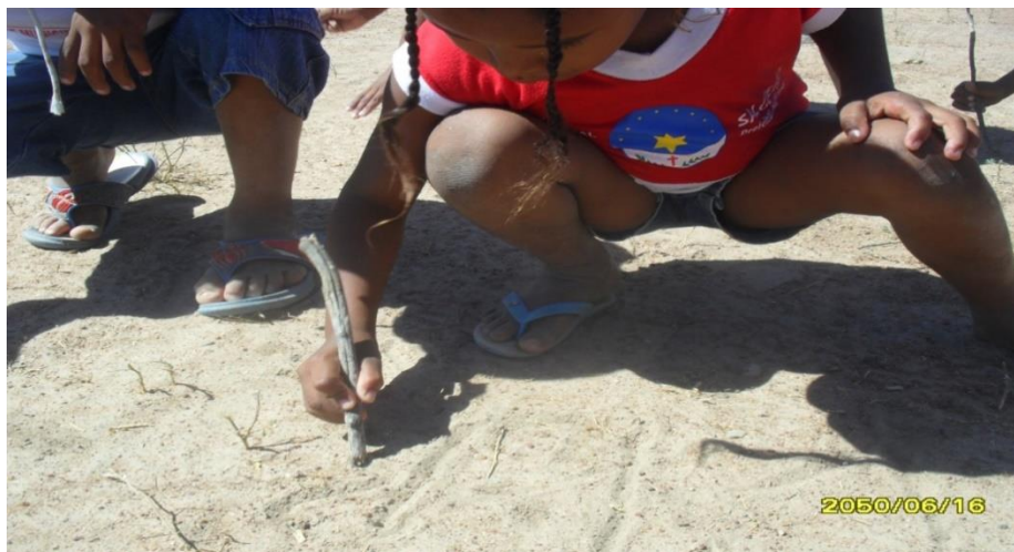
Foto 05 - Criança escrevendo com graveto