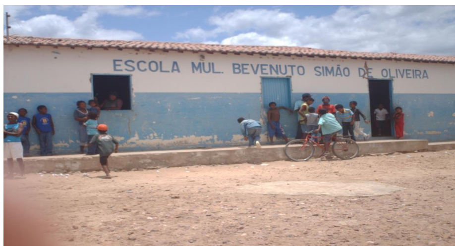
Foto 04 - Escola Municipal Bevenuto Simão

Em que pese todas as conquistas no território de Conceição das Crioulas até 2007, uma das quatro escolas, situada no Sítio Paula, estava numa situação de extrema precariedade no que se refere ao espaço físico e na definição do Projeto Pedagógico e Planejamento: a Escola Bevenuto Simão. Tivemos a curiosidade epistêmica de conhecer o processo de conquista pela comunidade desta escola, pois, em 2007, quando a comunidade assumiu a gestão, a escola não tinha porta, nem muro.