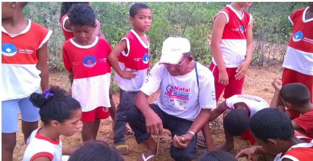
Foto 15 - Família participando do currículo: pai e artesão ensina sobre os tipos de solo