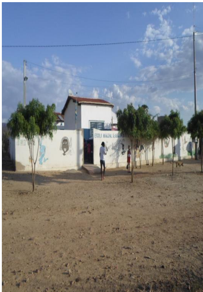
Foto 07 - Escola Bevenuto Simão em 2015 - Visão ampla