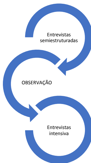
Figura 01 - Fluxograma da pesquisa