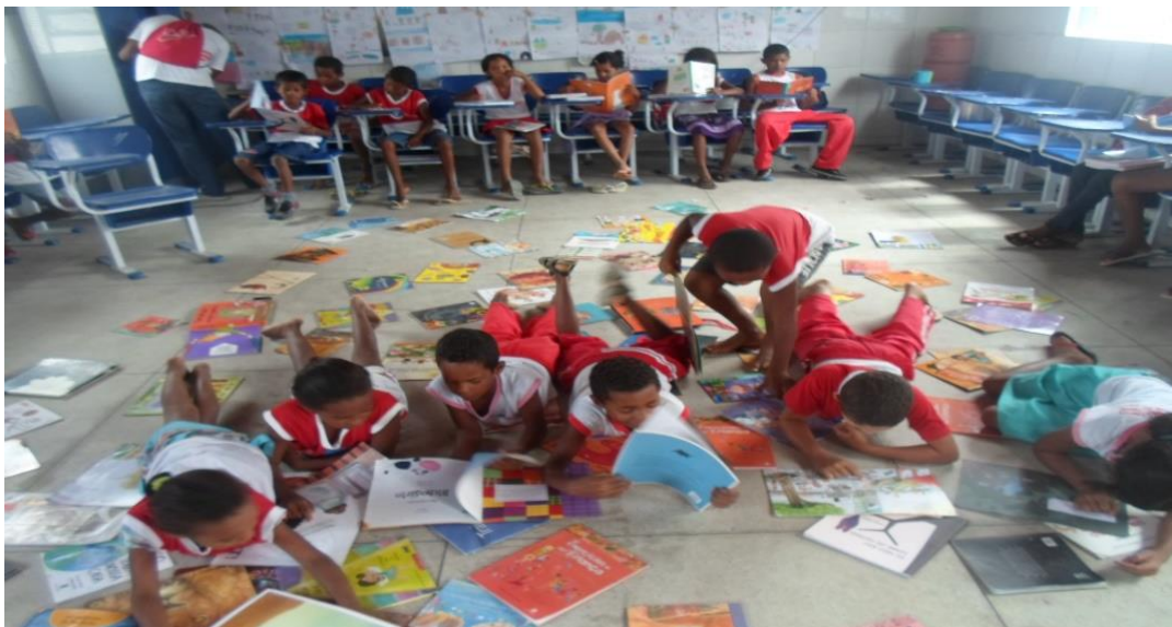
Foto 08 - Crianças em atividade de incentivo à leitura: “se achando nas histórias”

as crianças vão explorar, depois escolhem o livro e vão desenvolver a expressão artística que será proposta.