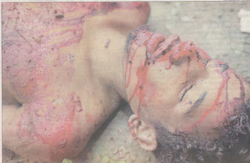
A polícia acredita que a vítima, desconhecida por moradores da comunidade, foi trazida e executada no local