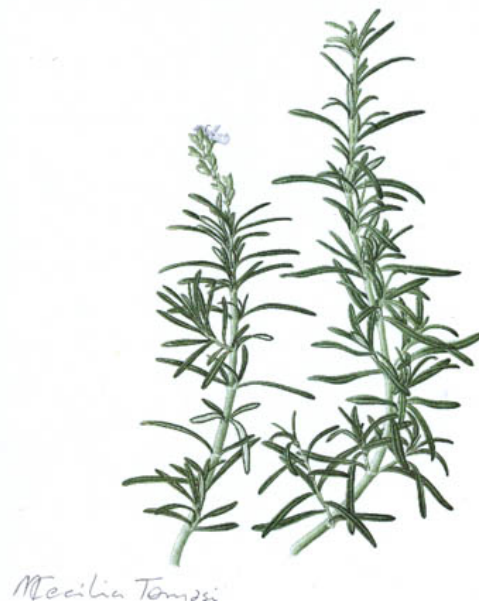
FIGURA 1 - Rosmarinus officinalis Linn.

O alecrim é utilizado na medicina popular como antiespasmódico (AL-SEREITI; ABU-AMER; SEN, 1999; ALONSO, 1998; FETROW; AVILA, 2000), analgésico, antiinflamatório (AL-SEREITI; ABU-AMER; SEN, 1999; FETROW; AVILA, 2000; NEWALL; ANDERSON; PHILLIPSON, 2002), antireumático, expectorante (AL-SEREITI; ABU-AMER; SEN, 1999), diurético (AL-SEREITI; ABU-AMER; SEN, 1999; ALONSO, 1998), colerético (ALONSO, 1998; SALLÉ, 1996), hepatoprotetor (ALONSO, 1998), e antifúngico (AL-SEREITI; ABU-AMER; SEN, 1999; NEWALL; ANDERSON; PHILLIPSON, 2002). Além de apresentar potencial terapêutico no tratamento de hepatotoxicidade, asma brônquica, úlceras pépticas, doenças inflamatórias, doenças cardíacas isquêmicas, astenozoospermia e na prevenção de carcinogênese (AL-SEREITI; ABU-AMER; SEN, 1999).