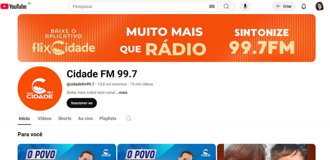
Figura 7 - Página oficial do Youtube da Rádio Cidade