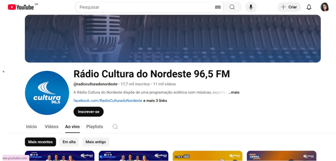
Figura 4 - Página oficial do Youtube da Rádio Cultura do Nordeste