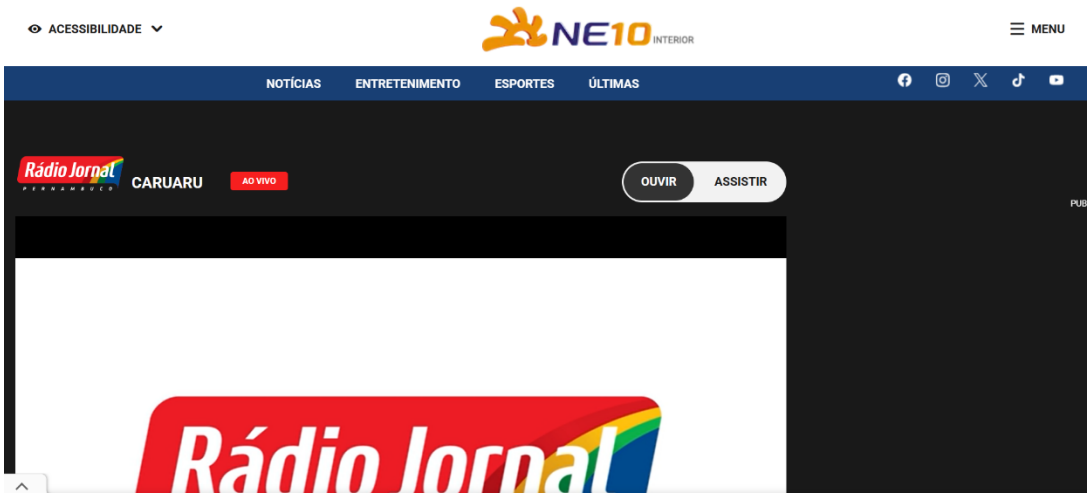
Figura 1 - Página inicial do site da Rádio Jornal