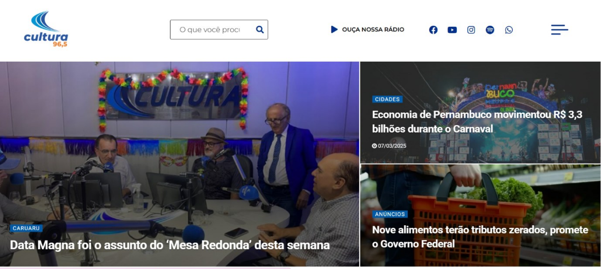
Figura 3 - Página inicial do site da Rádio Cultura do Nordeste