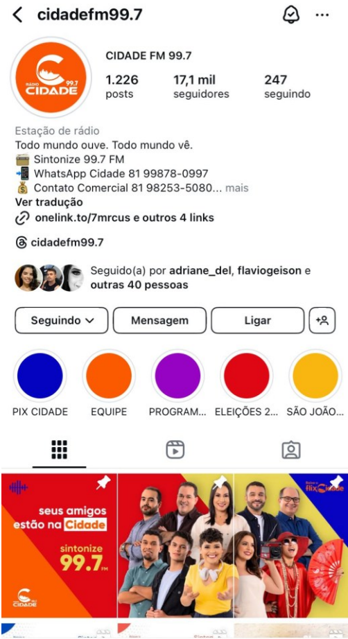
Figura 8 - Página oficial do Instagram da Rádio Cidade