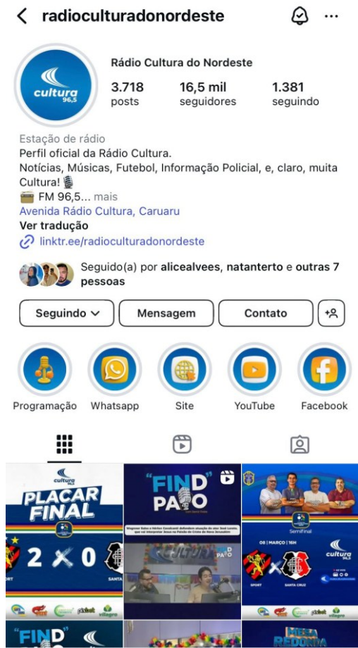
Figura 5 - Página oficial do Instagram da Rádio Cultura do Nordeste