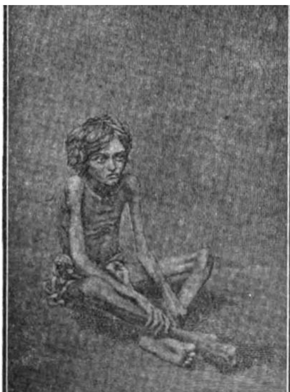
Gravuras 1 e 2 – Imagens de retirantes pelas ruas de Fortaleza

Quanto às referidas gravuras que representavam os retirantes, tidos como “verdadeiros esqueletos animados”, essas traziam a representação visual daquilo, há poucos anos, presenciado diretamente pelos habitantes de Fortaleza. Assim, o que outrora se conheceu presencialmente, agora se encontrava disposto num livro: