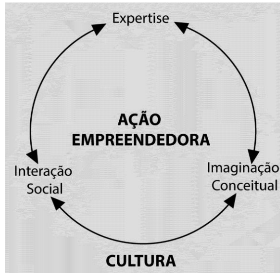
Figura 1: Categorias estruturais da ação empreendedora.

empreendimentos culturais. A Figura 1 demonstra o processo emergencial da ação empreendedora adaptado de Paiva Júnior (2004).