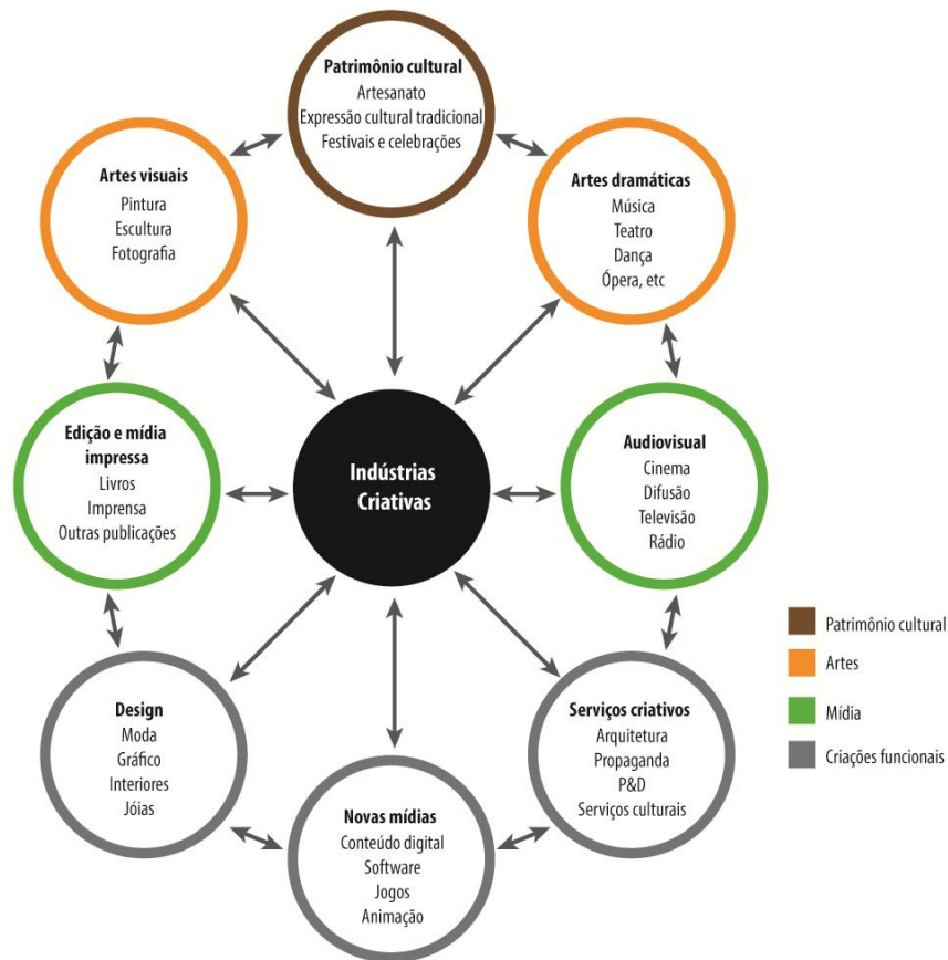
Figura 2: Categorias da Indústrias Criativas.

Segundo a UNCTAD, as indústrias criativas são divididas em quatro categorias e organizadas em nove subgrupos, como observado na Figura 2. A área audiovisual já se apresenta como uma das categorias da economia criativa e agrega as atividades de mídia como o cinema, a difusão, a televisão e o rádio.