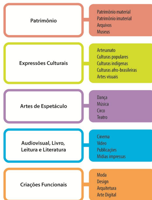
Figura 3: Escopo dos Setores Criativos.

Segundo o Plano Nacional de Economia Criativa (BRASIL, 2012), até recentemente, o escopo dos setores contemplados pelas políticas públicas do MinC se restringia àqueles de natureza tipicamente cultural (patrimônio, expressões culturais, artes de espetáculo, audiovisual e livro, leitura e literatura). Recentemente, esse escopo foi ampliado, contemplando também setores de base cultural, com um viés de aplicabilidade funcional (moda, design, arquitetura e artesanato). A Figura 3 apresenta a descrição dos setores criativos contemplados pelo Ministério da Cultura. Nela, percebemos o setor do audiovisual é visto como uma das categorias consideradas importantes e vem associado às atividades de publicações, mídias impressas e literatura.